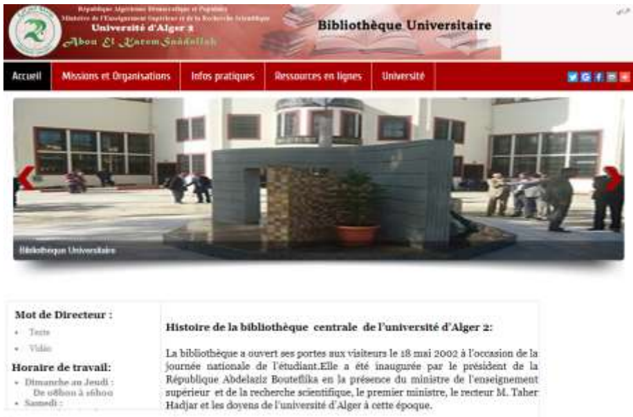
Figure n°2 : La page d'accueil du site web de la BU d'Alger 2

Contrairement à la précédente conception, la page web de la BU d'Alger 2 (figure n°2) ne laisse pas distinguer des raccourcis en icônes vers des ressources documentaires numériques, pourtant les bibliothèques grâce à l'environnement numérique se livrent une bataille pour reconquérir leurs publics qui se sont retournés vers les moteurs de recherche sur Internet en quête de documentation numérique.