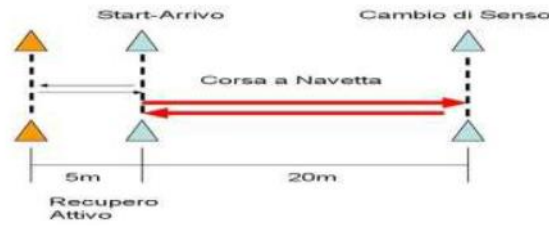
شكل رقم (01): يبين طريقة عمل اختبار يويو

- التسجيل: يتم اخذ القيمة التي توقف عندها اللاعب من الحاسوب.