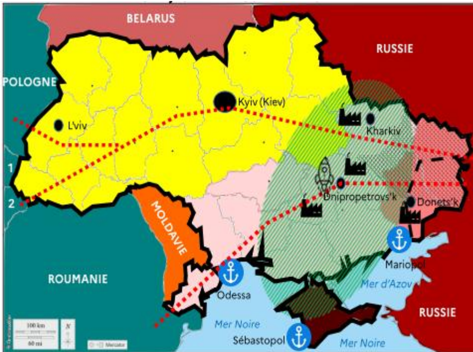
Carte n° 02 : Représente les enjeux de la guerre en Ukraine