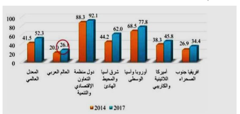
الشكل رقم 01: نسبة البالغين الذين قاموا بعمليات مدفوعات رقمية

1.1.2. المدفوعات الرقمية: من خلال الشكل الموالي ان العالم العربي قد عرف ارتفاعاً فيما يتعلق بإجراء عمليات مدفوعات رقمية من 20% في سنة 2014 إلى26% في سنة 2017.