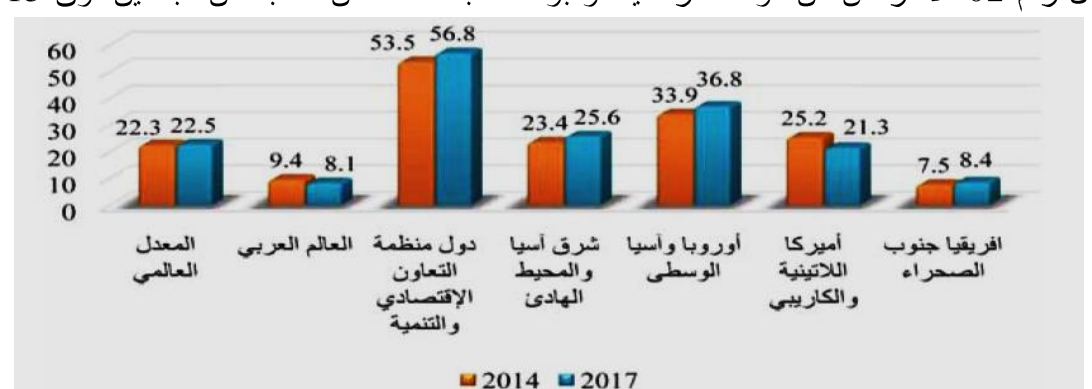
الشكل رقم 02: لاقتراض من مؤسسة رسمية أو بواسطة بطاقة ائتمان كنسبة من البالغين فوق 15سنة