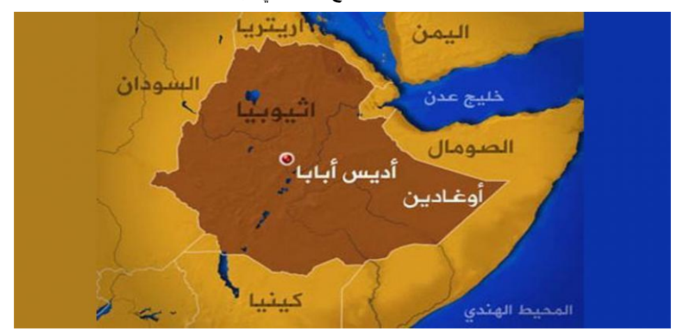
المصدر : محمد ناصر السعيد، تطور العلاقات البينية في القرن الإفريقي: أي مستقبل ينتظر الإقليم، قراءات افريقية، (2018/10/21)، نقلا عن الموقع: https://bit.ly/3THITmL، (2022/09/05).