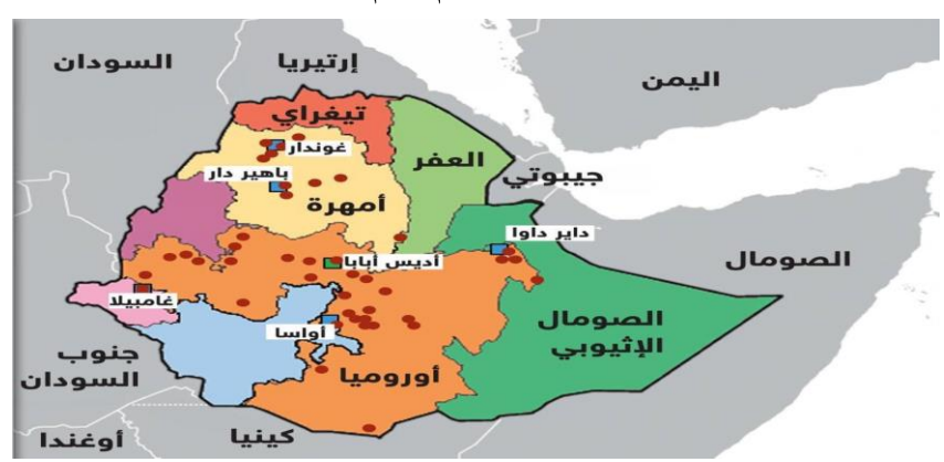
الخريطة 02: تقسيم أقاليم اثيوبيا

تعد إثيوبيا من الدول متعددة العرقيات، حيث يتواجد بها حوالي 80 عرقية، موزعة عبر 10 أقاليم من بينها إقليم تيغراي،<sup>13</sup> الذي يضم ثالث أكبر العرقيات بعد الأورومو والأمهرة.