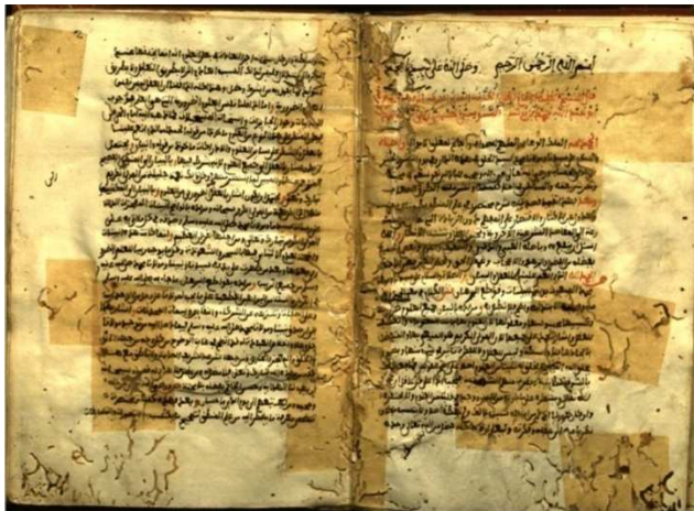
- صورة الورقة الأولى من النسخة (ب) -