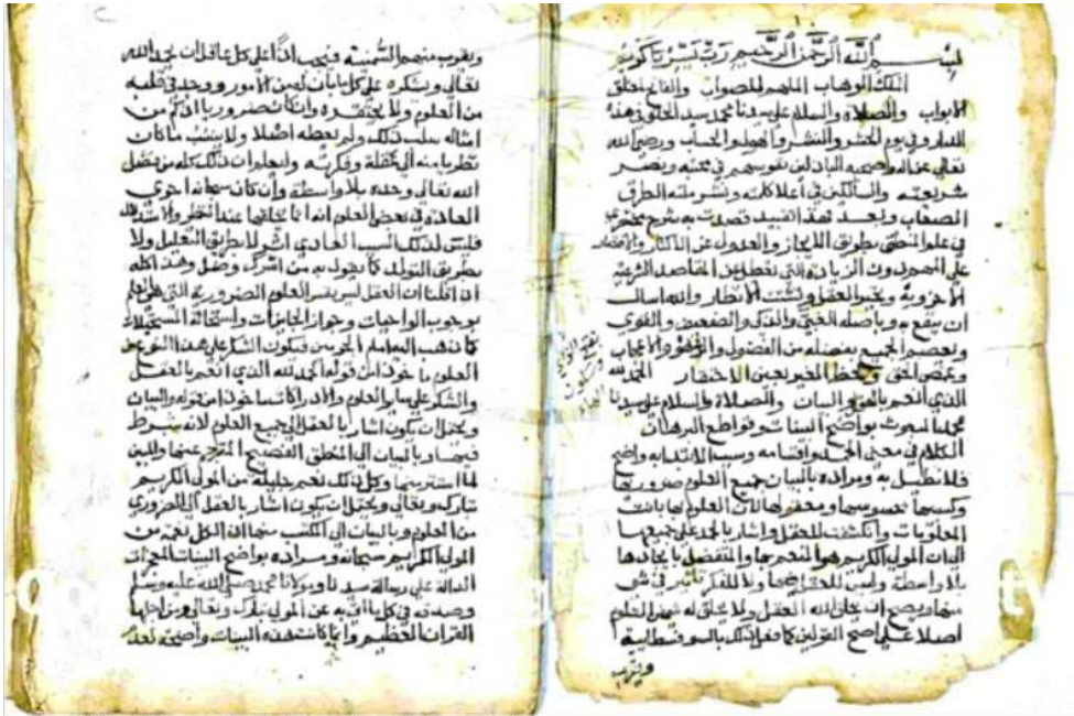
صورة للورقة الأولى من النسخة (أ) -