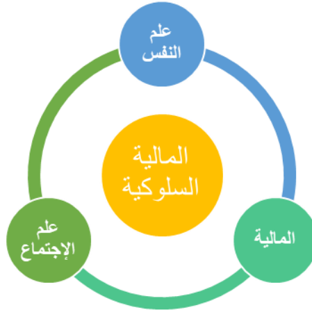
الشكل رقم (01): مفهوم المالية السلوكية