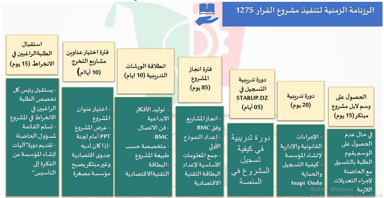
الشكل رقم 1: الرزمانة الزمنية لتنفيذ مشروع القرار 1275